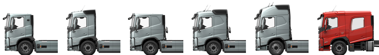
Lavt, kort førerhus