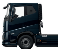
Lavt, langt førerhus